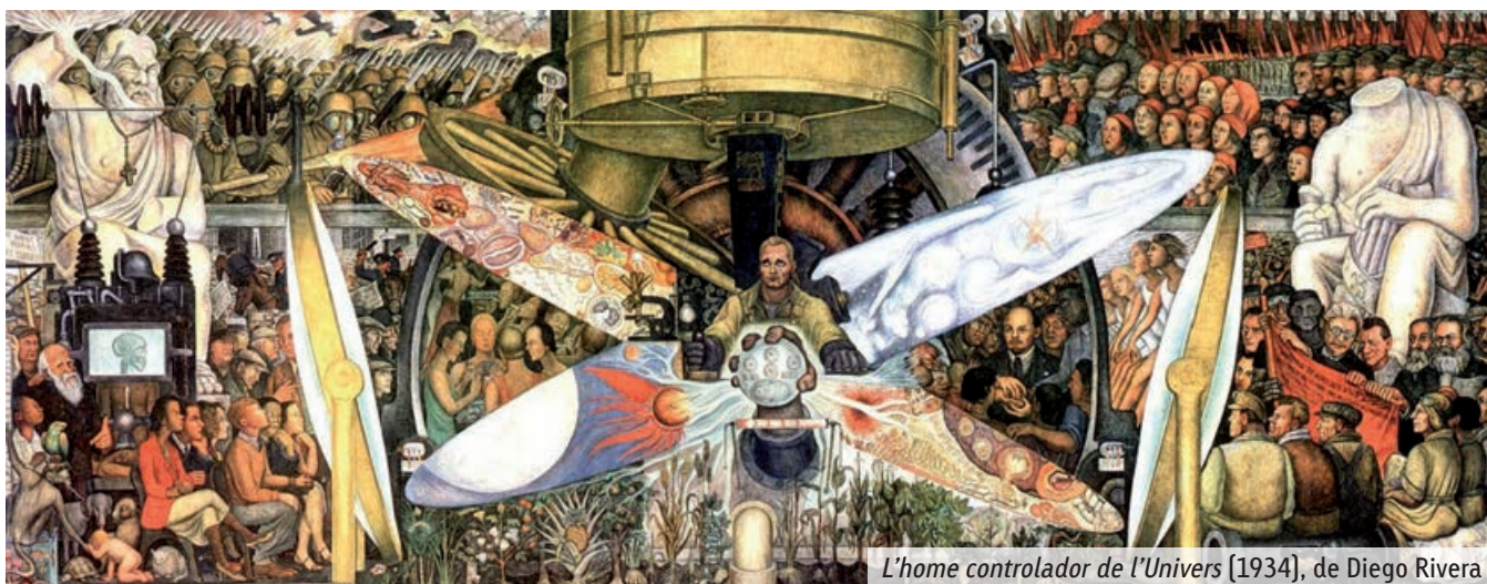
L'home controlador de l'Univers (1934), de Diego Rivera